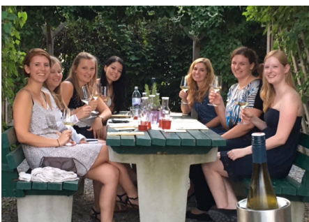
Die NHPs entspannen nach einer Radtour in der Wachau