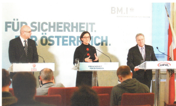
Im Kampf gegen Spiel- und Wettmanipulation ziehen Bundesliga, ÖFB und Innenministerium an einem gemeinsamen Strang.

D er Kampf gegen Manipulation im Sport wird im Frühjahr mit vollem Einsatz fortgesetzt. Nachdem in einem ersten Durchgang die Spieler aller 20 heimischen Bundesligaklubs „Play Fair Code“-Schulungen zur Prävention von Spielmanipulationen erhalten haben, stehen jetzt Vorträge in sämtlichen Nachwuchsakademien und Leistungssportschulen, bei den Schiedsrichtern sowie bei allen ÖFB-Nachwuchs- und -Frauen-